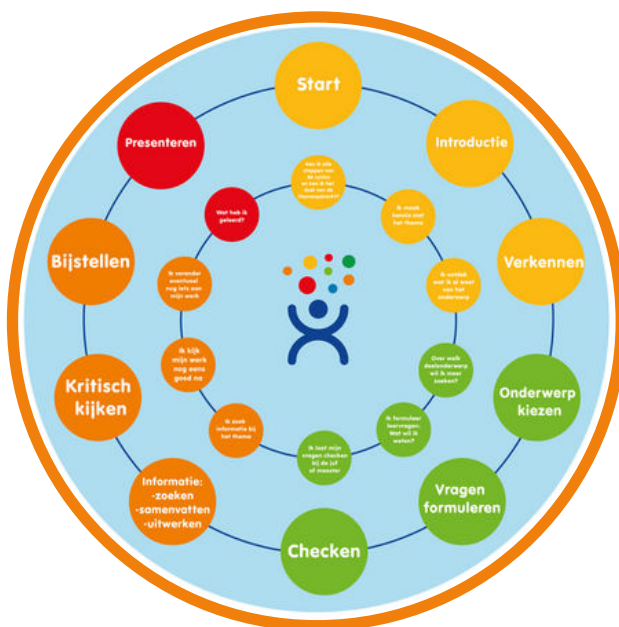
De onderzoekscyclus die wij ieder thema doorlopen. Per week zetten we nieuwe stappen in ons onderzoek

Aan het eind van thema vinden de presentaties plaats. De vorm van presenteren wisselt per thema. Het doel van de presentatie is dat alles samenkomt en dat wij van elkaar kunnen zien wat we geleerd hebben. Presenteren doen we altijd met elkaar. De verschillende groepen komen samen om elkaar te laten zien wat er is gemaakt en is geleerd. Ook krijgen ouders geregeld de kans om een presentatie bij te wonen.